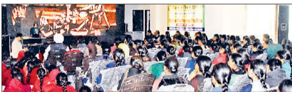
फतेहाबाद। सैंड आर्ट शो के माध्यम से साहिबजादों की शहादत का सजीव चित्रण करते हुए एनएसबी प्रोडक्शन के कलाकार।

हरियाणा सरकार द्वारा श्री गुरु गोबिंद सिंह जी के चार साहिबजादों के बलिदान के संदेश को जन-जन तक पहुंचाने के उद्देश्य से सैंड आर्ट शो व जिला स्तरीय निबंध लेखन प्रतियोगिता आयोजित करवाई जा रही है। इसी कड़ी में बुधवार को वीर बाल दिवस के उपलक्ष्य में राजकीय वरिष्ठ माध्यमिक विद्यालय मताना के परिसर में एनएसबी प्रोडक्शन के