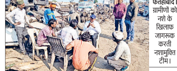
फतेहाबाद। ग्रामीणों को नशे के खिलाफ जागसक करती नशामुक्ति टीम।