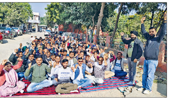
ऑनलाइन ट्रांसफर के विरोध में प्रदर्शन करते बिजली कर्मचारी।