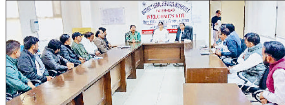
फतेहाबाद। सरपंचों, पंचों व ग्राम सचिवों की बैठक की अध्यक्षता करते हुए सीजेएम।

जिला में नशा मुक्त हरियाणा मिशन व बाल विवाह मुक्त भारत अभियान को गति देने के लिए जागरूकता अभियान चलाया जा रहा है। जिला विधिक सेवाएं प्राधिकरण द्वारा 7 दिसंबर से 7 जनवरी तक चलने वाले इस नशा मुक्त हरियाणा मिशन के तहत जागरूकता अभियान के माध्यम से आमजन विशेष कर युवाओं को नशे के जानलेवा खतरों से दूर रहने के लिए प्रेरित कर रहा है। अभियान की ओर अधिक गति देने के लिए जिला एडीआर सेंटर में फतेहाबाद खंड के सरपंचों, पंचों व ग्राम सचिवों के