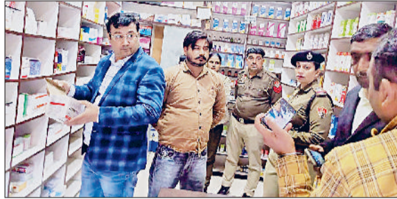
रतिया। मेडिकल दुकानों पर जांच करते अधिकारी।