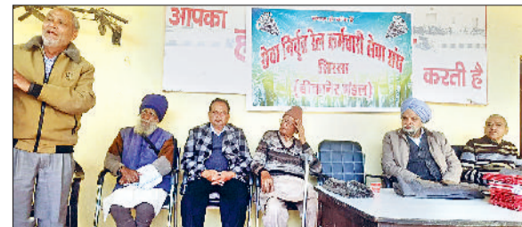
सिरसा। सेवानिवृत्त रेल कर्मचारी सेवा संघ की बैठक में उपस्थित सदस्य।

एनडीपीएस अधिनियम के कानूनी प्रावधानों के बारे में जागरूक करना है। उन्होंने बताया कि इस अभियान का उद्देश्य नशे की गिरफ्त में आ चुके युवाओं को मुख्य धारा से जोड़ना है। ऐसा ही है जिले में उपलब्ध पुनर्वास सेवाओं के बारे में भी विस्तार से बताया जाएगा।