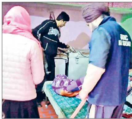
गुरुनानकपुरा में तलाशी अभियान चलाती पुलिस टीम।