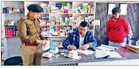
इन मेडिकल स्टोर्स पर की जांच