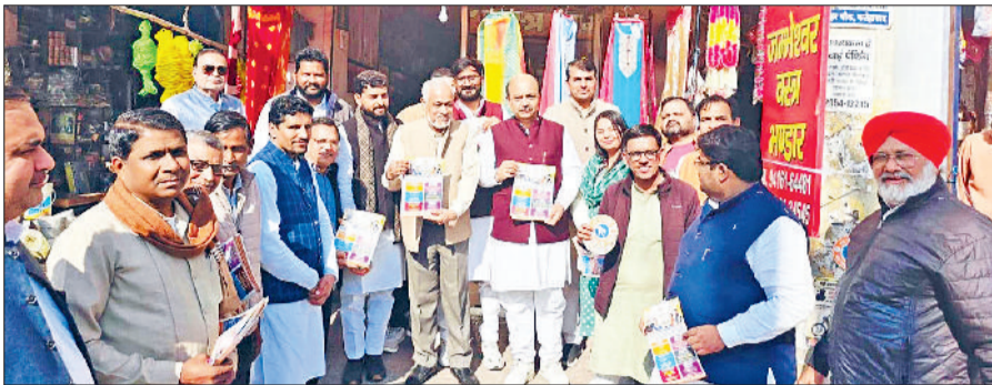
फतेहाबाद। आत्मनिर्भर भारत यात्रा के दौरान स्वदेशी अपनाने की अपील करते भाजपा नेता।