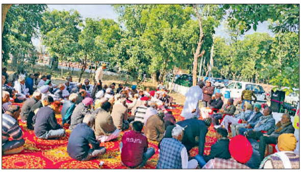
फतेहाबाद। डीसी कार्यालय पर मांगों को लेकर धरना देते रिटायर्ड कर्मचारी सिरसा में

पेंशनर्स विरोधी वित्त विधेयक 2025 के विरोध में जिलेभर के रिटायर्ड कर्मचारियों ने बुधवार को रिटायर्ड कर्मचारी संघ के आह्वान पर फतेहाबाद में रोष प्रदर्शन किया। सैकड़ों रिटायर्ड कर्मचारियों ने डीसी कार्यालय पर धरना देते हुए सरकार के खिलाफ जमकर नारेबाजी की और उपायुक्त के माध्यम से प्रधानमंत्री को ज्ञापन भेजा गया।