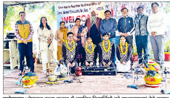
फतेहाबाद। नेशनल कला उत्सव में चयनित विद्यार्थियों को शुभकामनाएं देते स्टाफ सदस्य।

कलात्मक प्रतिभा को राष्ट्रीय स्तर पर प्रस्तुत करेंगे। छात्रों की इस उपलब्धि पर बुधवार को विद्यालय